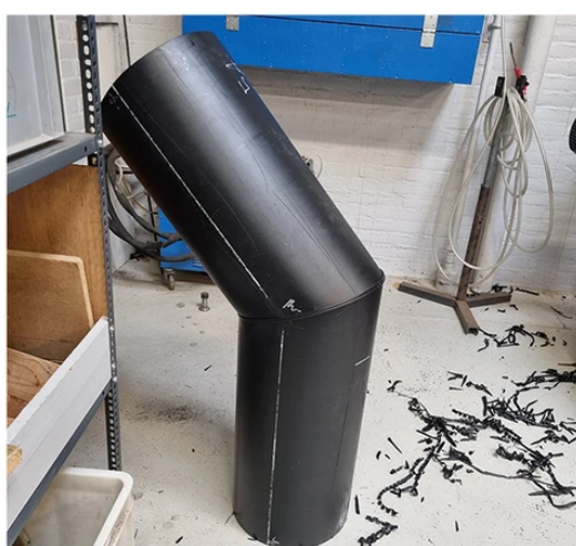
Billeder fra undervisning på kurset 'svejsning af tykvæggede plastmaterialer' på AMU SYD.